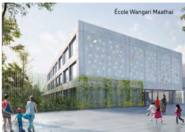
École Wangari Maathai

La rentrée 2023 met deux femmes engagées à l'honneur, avec l'inauguration de deux nouvelles écoles. Dans le quartier Duivivier , l'école Frida Kahlo rend hommage à la peintre mexicaine et militante féministe. Rue Croix Barret , l'école Wangari Maathai honore la biologiste kényane, médecin, militante écologiste et politique. Deux noms choisis par les élèves, la communauté éducative et les conseils de quartier.