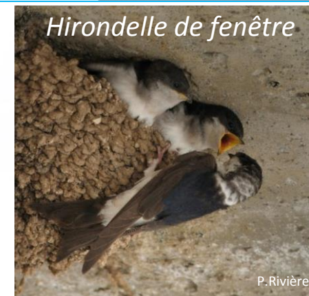
Hirondelle de fenêtre

En France -40 % sur les 10 dernières années (données STOC 2018) Quasi-menacée (données INPN 2016)