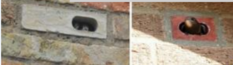
Nichoirs à martinets intégrés