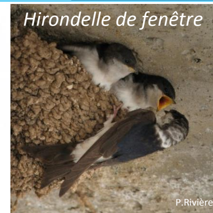
Hirondelle de fenêtre

En France -40 % sur les 10 dernières années (données STOC 2018) Quasi-menacée (données INPN 2016)