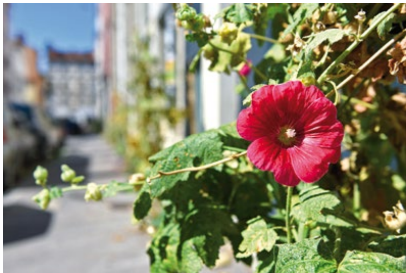
Une rose trémière, reine des MIF.

Plus récents, car fruits d'une prise de conscience née au 21 e siècle, les 53 jardins partagés de Lyon occupent également du foncier public