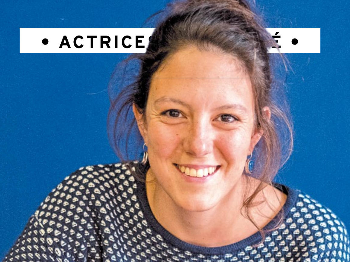
Déjà se profilent ses prochaines dates : Agatha de Duras au TNP en février 2020, un spectacle pour enfant aux Clochards, la reprise de Rebibbia à Paris au printemps et même un premier opéra fin 2020 !