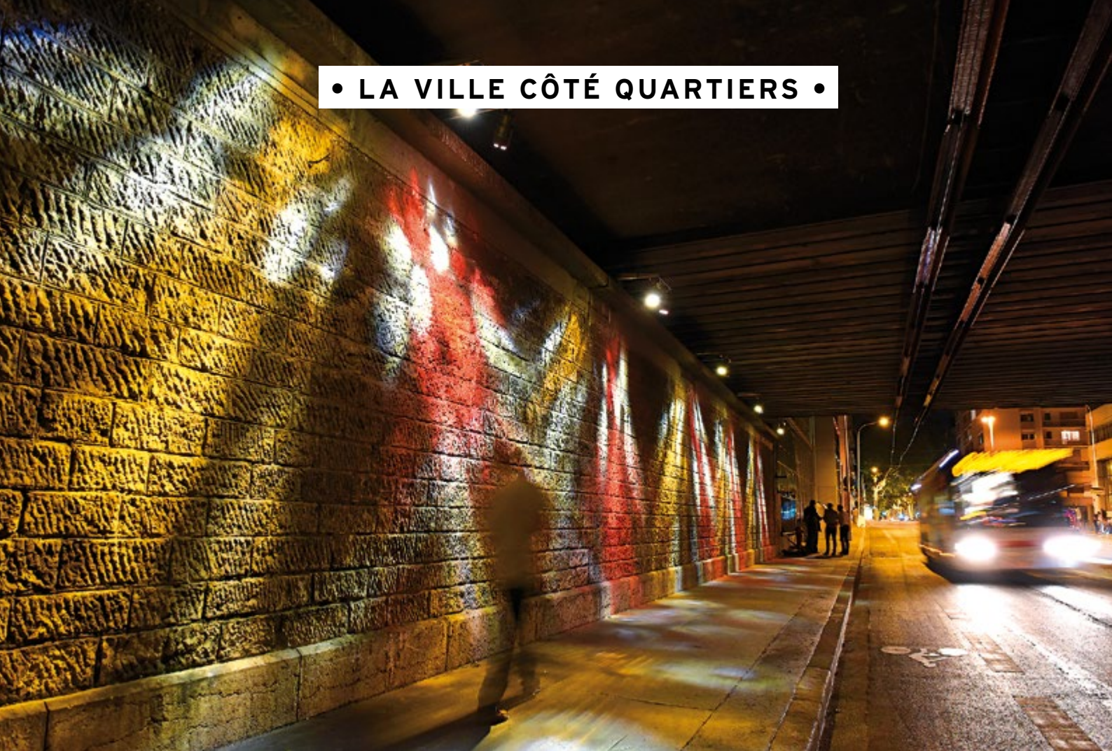
Le passage Félix Faure tout en couleurs, dans le 3 e arrondissement.