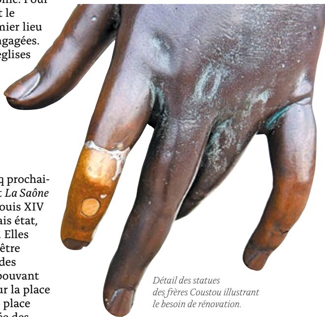
Détail des statues des frères Coustou illustrant le besoin de rénovation.

Enfin, une étude sera lancée pour restaurer le jardin archéologique du Vieux-Lyon, situé contre la cathédrale Saint-Jean, et y créer un espace vert de qualité.