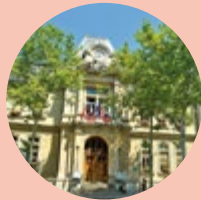
Le Maire du 4 e

Nous sortons d'un été particulièrement chaud qui nous rappelle, s'il était encore nécessaire de le faire, combien l'urgence climatique nous impose de repenser la ville et nos habitudes. Pour un arrondissement plus respirable et plus frais, nous devons favoriser encore et toujours le développement de la nature en ville. Sur le cours d'Herbouville, au clos Jouve ou bien encore sur la petite place Lebrun, les prochains mois verront la plantation d'arbres et d'arbustes en pleine terre, de prairies et de fleurs, qui offriront, dès l'été prochain, de nouveaux refuges ombragés aux Croix-Roussiens. Outre l'embellissement de notre cadre de vie et l'accroissement de la biodiversité en ville, la végétalisation est une des réponses pour atténuer les effets des épisodes de chaleur qui reviendront inévitablement si nous ne prenons pas la mesure du défi climatique.