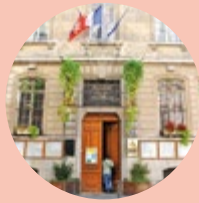
Le Maire du 6 e

Le 7 novembre, de 14h à 17h, la Mairie du 6 e arrondissement se mobilise une nouvelle fois pour l'emploi, en organisant, en partenariat avec la Maison Métropolitaine d'Insertion pour l'Emploi (MMIE), un forum banque. Plusieurs établissements bancaires seront présents pour recruter des candidats de tous âges dont le niveau de diplôme peut aller de sans bac à bac +4. Pour pouvoir participer, il faudra se rendre à la Mairie du 6 e , prévoir 4 exemplaires de CV et vous inscrire préalablement, avant le 1 er novembre, via ce lien : yurplan.com/event/Forum-Banque-Mairie-du-6eme/46812 . Plus d'informations sur le site de la MMIE : lyonmetropole-mmie.fr/agenda.html .