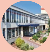
Le Maire du 8 e

Depuis maintenant plus de 10 ans, la Semaine bleue prend ses aises et se transforme en Mois bleu. Un mois dédié à nos aînés où la mairie, ses partenaires et les résidences de l'arrondissement, donnent la possibilité aux seniors de participer à des sorties culturelles, des conférences, des formations aux nouvelles technologies et des moments festifs ! J'aimerais à cette occasion saluer l'engagement sans failles de toutes les associations, du personnel municipal, des familles et des aidants qui, chaque jour, accompagnent et créent ce lien entre les générations. Le mois d'octobre est également l'occasion pour l'arrondissement d'accueillir ses nouveaux arrivants et de célébrer le cinéma avec le Festival Lumière (plus d'information en mairie et sur mairie8.lyon.fr ).