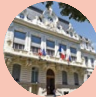
La Maire du 7 e

Depuis la rentrée, les habitants de Jean Macé profitent d'un mail paysager à l'angle des rues d'Anvers et Grignard, dont l'aménagement a été pensé avec le Conseil de quartier. Cette place est désormais dénommée en hommage à Jean-Pierre Flaconnèche, Maire du 7 e de 2001 à 2014. Mais, au-delà de l'ancien dépôt TCL, le quartier offre d'autres exemples de reconversion. Sur l'avenue Berthelot, GRDF va bientôt investir le garage Ford, dans le premier bâtiment contemporain tertiaire construit en pierre massive. Et, d'ici à décembre, une auberge de jeunesse nouvelle génération longera la rue Zimmermann : Jean Macé participe lui aussi à la métamorphose du 7 e .