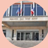
Le Maire du 9 e

Avec environ 6500 établissements et 32000 emplois salariés, l'emploi se porte bien dans le 9 e . Le tissu économique est soutenu par la dynamique des services aux entreprises dont les postes enregistrent la plus forte progression en nombre. Lyon Vaise Industrie est devenu le premier pôle numérique et logiciel métropolitain. Des entreprises contribuent à cet essor des activités informatiques sur le territoire comme Cegid, CGI et, demain, Bandai Namco.