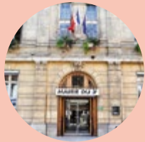
La Maire du 3 e

La 15 e Biennale d'art contemporain de Lyon attire déjà de nombreux visiteurs aux Usines Fagor et au musée d'Art contemporain. Ce rendez-vous permet également d'inviter collectifs d'artistes, galeries, associations, écoles d'art et d'architecture à participer au festival off, Résonance. Dans le 3 e , le programme est varié : les marches performatives d'ABI/ABO, vous emmènent à la découverte des sites de friches artistiques, l'ancienne robinetterie de la rue Pionchon vous ouvre ses portes et accueille les expositions proposées par l'association Lamartine, la Bibliothèque municipale de la Part-Dieu invite l'artiste Jacqueline Salmon à porter un regard d'auteur sur le silo de conservation des documents, et bien sûr, le Conseil de quartier Mutualité-Préfecture-Moncey vous propose de découvrir Arborescence , l'œuvre éphémère de l'artiste Cédric Esturillo, installée jusqu'au 5 janvier place Guichard.