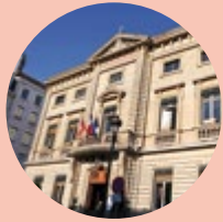
Le Maire du 2 e

Depuis plus d'un an, les habitants du centre-ville subissent les nuisances de rodéos sauvages tous les vendredis et samedis soir. Les réponses apportées par la Ville n'ont malheureusement pas suffi. Entre provocation et exaspération, la tension est montée jusqu'à en venir à des dégradations de biens. D'une question de tranquillité, on est passé à un problème de sécurité. Il faut maintenant rétablir l'ordre. Plus d'effectifs et de véhicules de police nationale, la police municipale qui reste mobilisée, l'étude de bornes rétractables pour limiter les accès à certaines rues et la vidéo-verbalisation, il faut au moins cela pour éradiquer le problème et non pas seulement le déplacer. La "sûreté" des personnes figure dans la Déclaration des Droits de l'Homme. Quels que soient les moyens requis, elle doit être assurée.