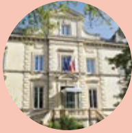
La Maire du 5 e

Le 5 e arrondissement voit son offre de santé renforcée grâce à la Croix-Rouge. L'ouest de l'agglomération lyonnaise bénéficiera de services de santé d'une haute technicité et prenant en compte le bien-être des patients. En effet, dans un premier temps, l'équipe de radiologues de la Sauvegarde-Massues a inauguré, le 26 septembre dernier, le service d'imagerie de la maison médicale situé au 86 rue Edmond-Locard. Il est équipé d'un scanner et d'un IRM. Le 18 octobre, la Croix-Rouge française inaugurera le nouveau Centre des Massues qui, aujourd'hui, propose, en plus des activités de chirurgie orthopédique complexe de l'appareil locomoteur et de rééducation et réadaptation fonctionnelles, des prises en charge en médecine et rééducation gériatrique ainsi qu'en soins palliatifs.